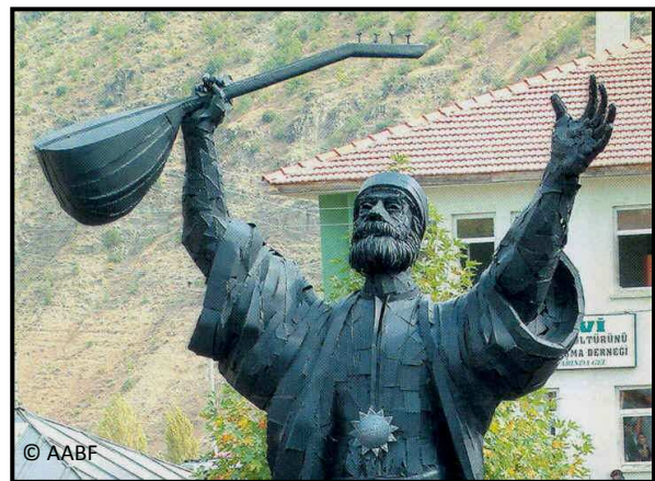
Haci Bektaş Veli mit Saz – Denkmal

Damit landen wir wieder bei den Vorsokratikern – Anaximenes (585-495): die göttliche Luft, an der der Mensch durch den lebensnotwendigen Atem Anteil hat. Das Instrument Saz , das mit seinen schwingenden Saiten Luft tönen lässt, aus Luft und Spannung Musik macht, findet als